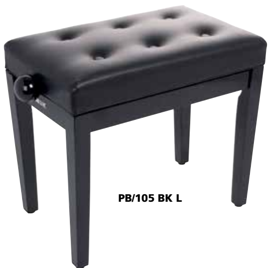
PB/105 BK L