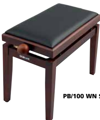
PB/100 WN S