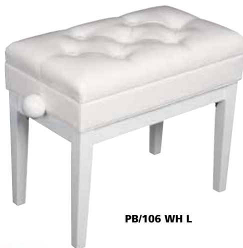
PB/106 WH L