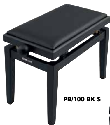
PB/100 BK S