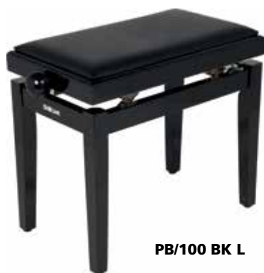
PB/100 BK L