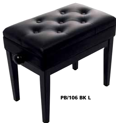
PB/106 BK L