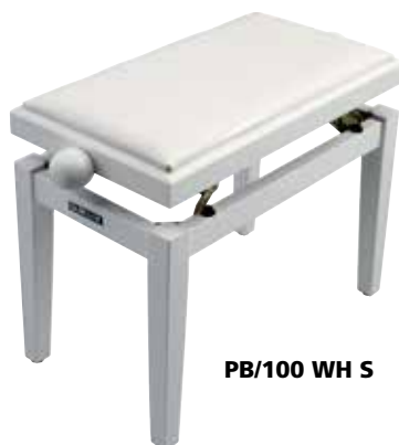
PB/100 WH S